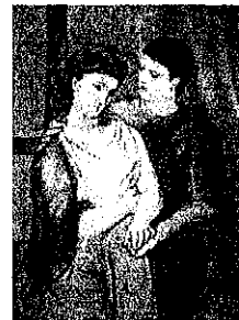
P. PICASSO, Gli amanti , 1923

«Tra l'altre distinzioni e privilegi che le erano stati concessi, per compensarla di non poter esser badessa, c'era anche quello di stare in un quartiere a parte. Quel lato del monastero era contiguo a una casa abitata da un giovine, scellerato di professione, uno de' tanti, che, in que' tempi, e co' loro sgherri, e con l'alleanze d'altri scellerati, potevano, fino a un certo segno, ridersi della forza pubblica e delle leggi. Il nostro manoscritto lo nomina Egidio, senza parlar del casato. Costui, da una sua finestrina che dominava un cortiletto di quel quartiere, avendo veduta Gertrude qualche volta passare o girandolar lì, per ozio, allettato anzi che atterrito dai pericoli e dall'empietà dell'impresa, un giorno osò rivolgerle il discorso. La sventurata rispose.»