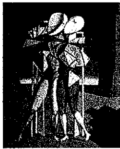
G. DE CHIRICO, Ettore e Andromaca , 1917